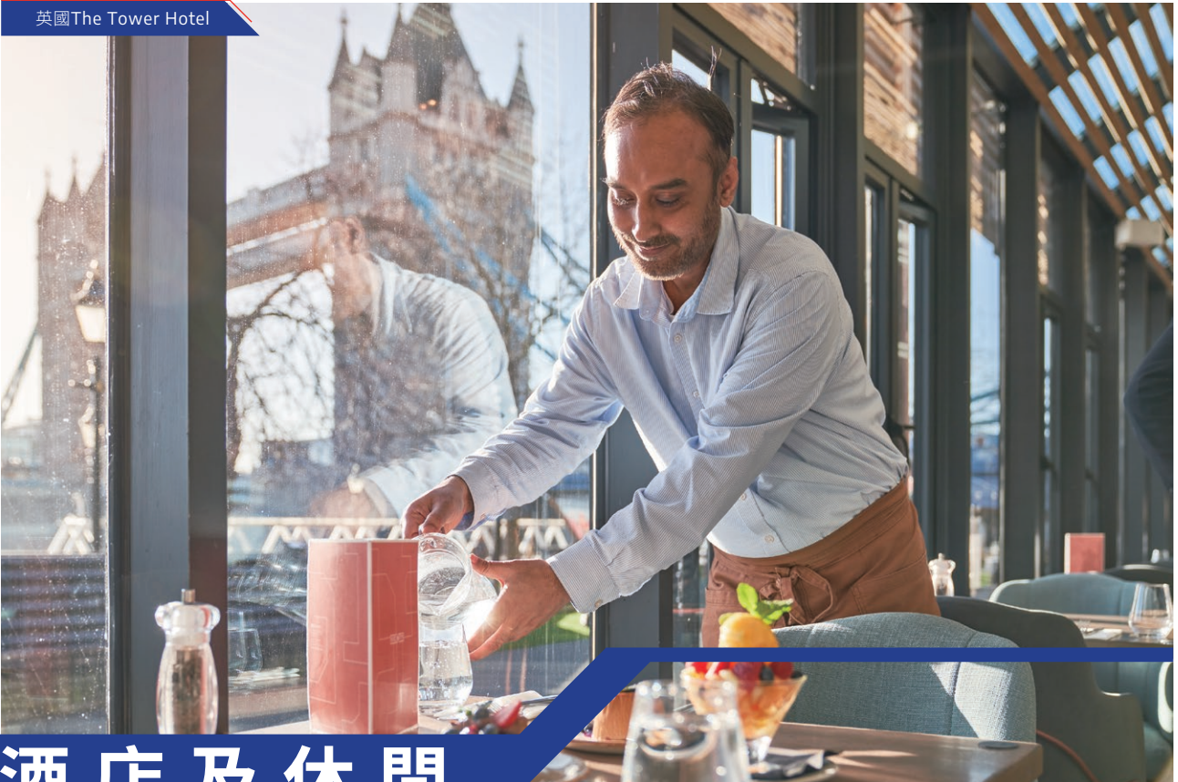
英國The Tower Hotel