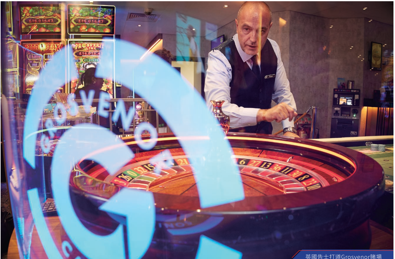
英國告士打道Grosvenor賭場