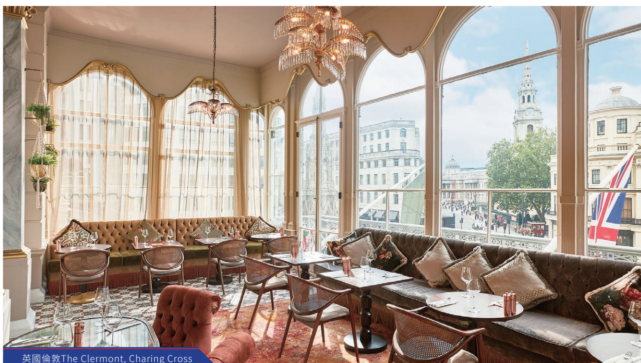
英國倫敦The Clermont, Charing Cross

展望今年及未來，CHG會以加強財務基礎、對倫敦市場抱持的謹慎樂觀態度，以及其團隊的高度敬業和積極進取精神，為公司未來的業務發展奠定堅實基礎。