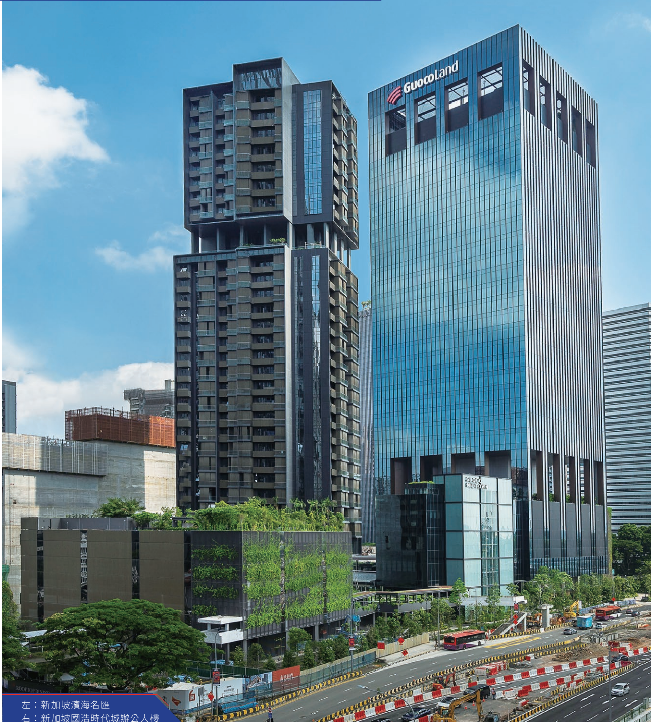
左：新加坡濱海名匯 右：新加坡國浩時代城辦公大樓