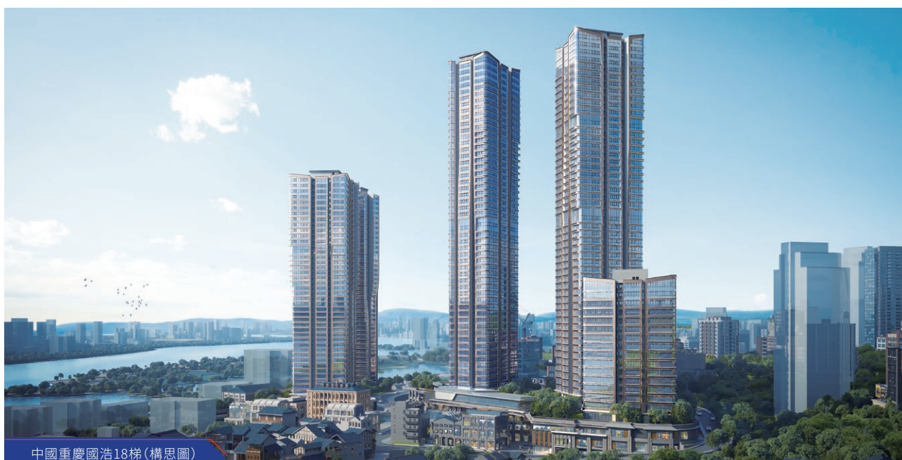
中國重慶國浩18梯(構思圖)

在馬來西亞，官方預測二零二四年國內生產總值將增長4%至5%，數據顯示住宅物業市場於二零二四年第一季度有所改善，銷量有所增加。然而，高利率、建築成本上升以及大多數市場物業供過於求等挑戰依然存在。根據分析師的資料，巴生谷(Klang Valley)地區的寫字樓市場於二零二四年上半年的整體出租率及租金均略有提高。然而，在供應過剩的情況下，寫字樓行業的前景仍然充滿挑戰。