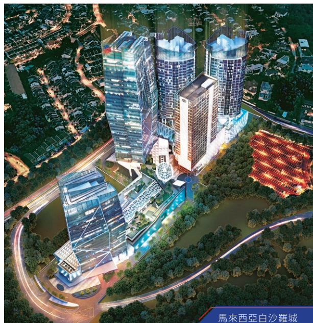
馬來西亞白沙羅城

在中國，一系列促進房地產行業發展的政策相繼出台。二零二四年上半年，多數房地產指標繼續呈下降趨勢。官方數據顯示，一線和二線城市的七月新房季度價格分別下降0.5%及0.6%。根據分析師的資料，二零二四年第二季度上海甲級寫字樓淨吸納量有所增加，較上一季度增長近一倍。由於上海寫字樓供應量大，分析師預期租金增長將受抑。