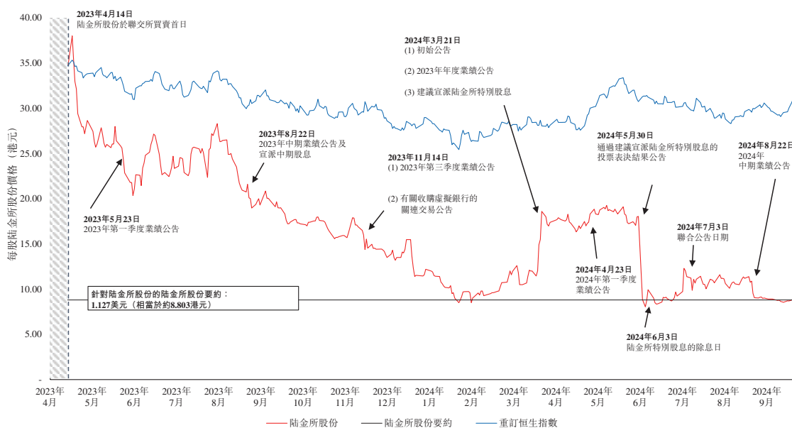
圖1 – 陆金所股份於陆金所股份回顧期間的相對歷史價格表現