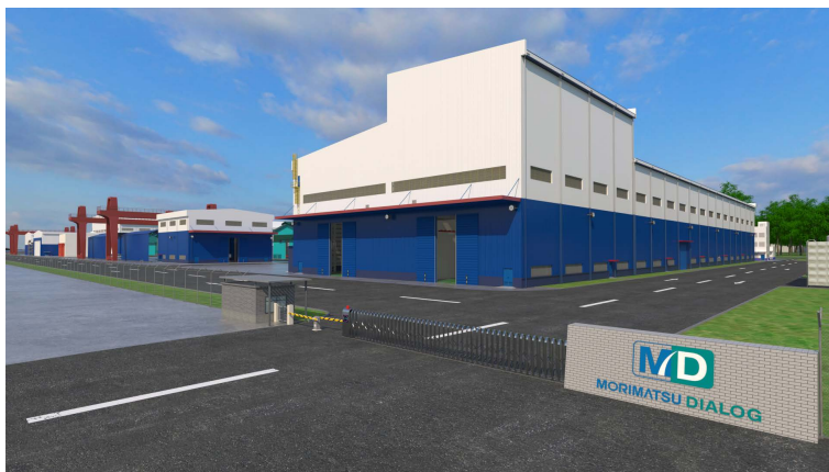
馬來西亞製造基地(設計效果圖)

於報告期內，本公司附屬公司Morimatsu Dialog的製造基地擴建項目正在按計劃穩步推進，其將主要服務於動力電池原材料、能源化工以及製藥和生物製藥領域。該製造基地坐落於地理位置優越的邊佳蘭地區，不僅可以滿足當地的市場需求，還能有效地輻射到東南亞、中東和北美市場。該擴建項目的總投資金額約為6,000萬美元，預計將於2025年第一季度逐步完成交付。