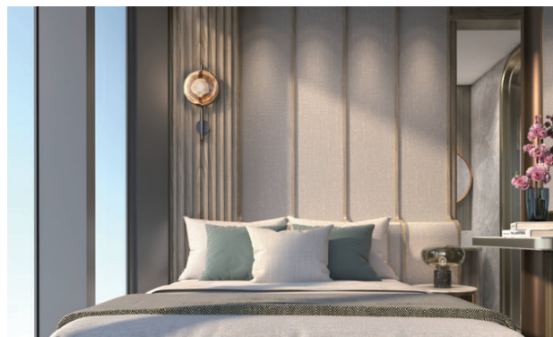
★ 以上所有圖片為室內設計效果圖。