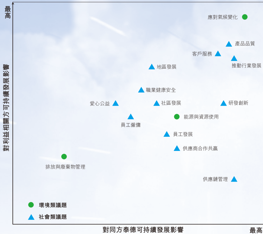
同方泰德ESG議題重要性矩陣

量化原則： 本集團依據聯交所「上市規則指引－附錄C2環境、社會及管治報告指引」中「關鍵績效指標」要求，對「環境」和「社會」範疇量化指標進行披露，對不具有重要性的指標進行解釋。