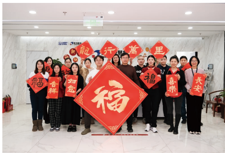
公司員工生日會及節假日福利