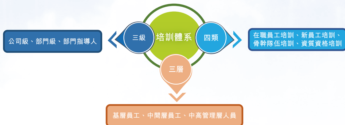
集團人才培訓體系

本集團制定實施《培訓管理制度》，構建了「三級」「四類」「三層」的培訓體系，培訓內容針對性覆蓋企業管理、領導力、資質認證、技能培訓、企業文化等內容，完善員工知識體系和技能水平，突出關鍵人才培養，為集團經營改善奠定了堅實基礎。此外，《培訓管理制度》還規定了培訓機制、培訓信息反饋內容，以保障培訓效果，不斷提升改進員工培訓工作。