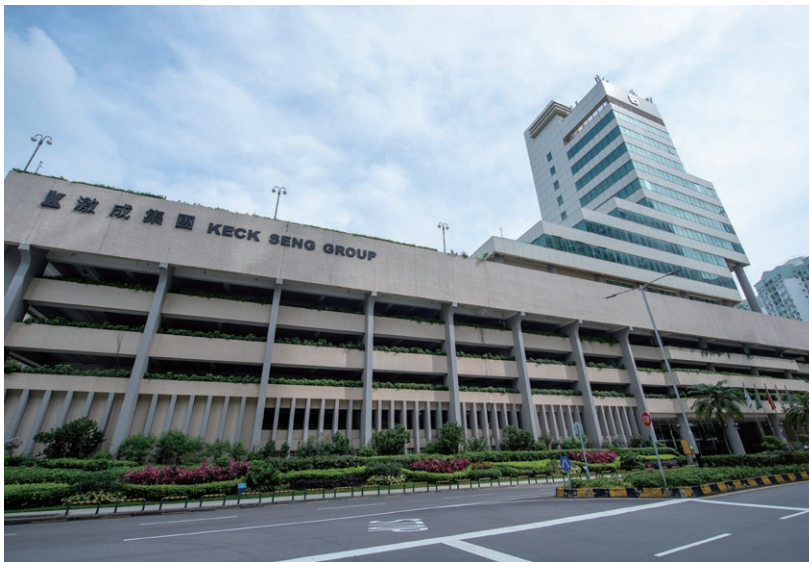
Ocean Tower, Macau 澳門海洋大廈