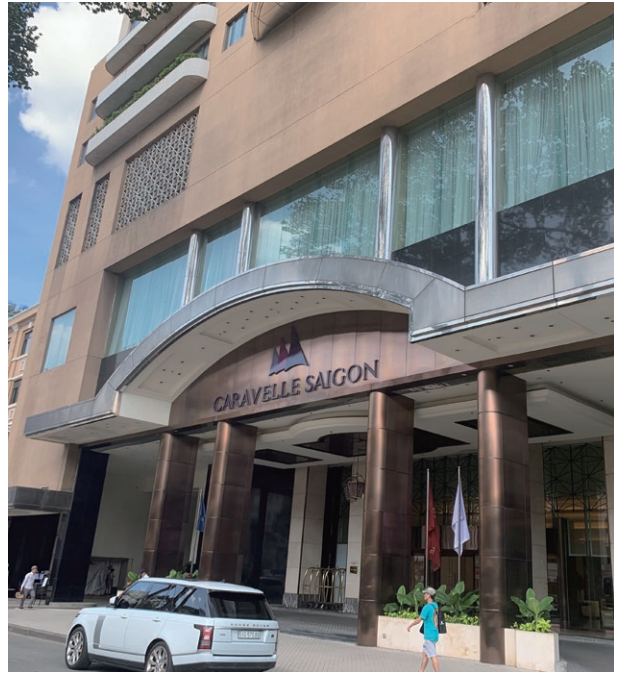
Caravelle Saigon Hotel, Vietnam 越南胡志明市帆船酒店