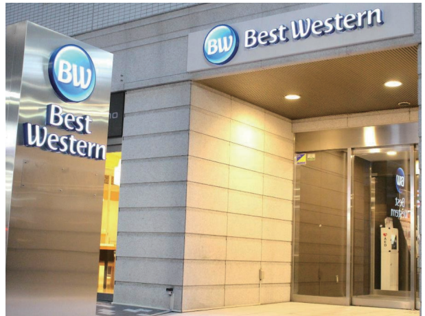
Best Western Osaka Hotel, Japan 日本大阪心齋橋西佳酒店