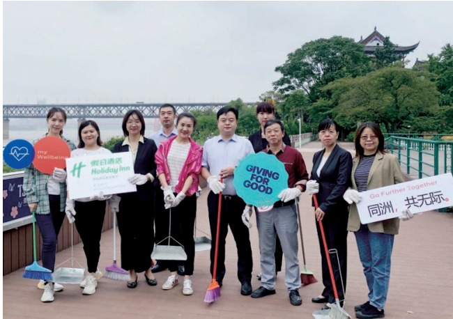
Clean the river beach 清潔河堤