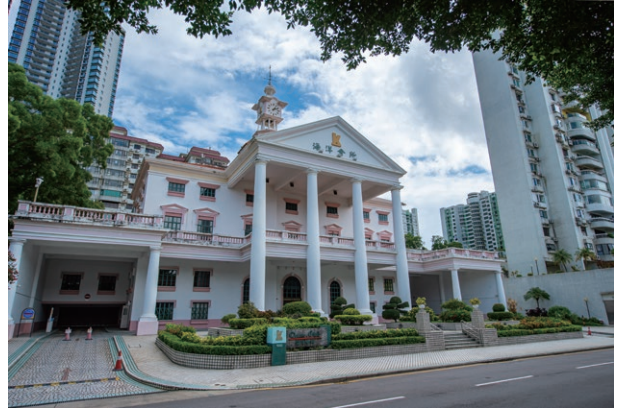
Ocean Club, Macau 澳門海洋會所