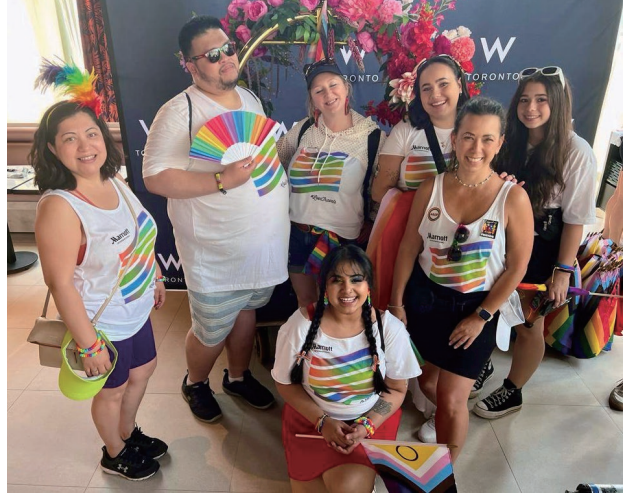
Pride Parade 同志遊行