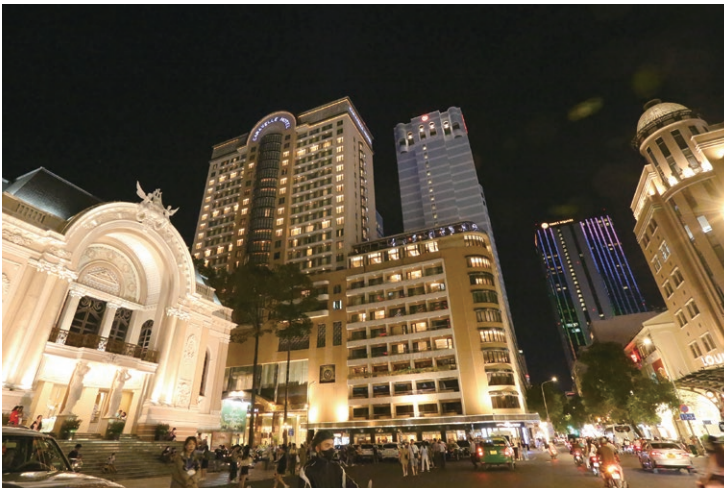
Earth Hour 地球一小時