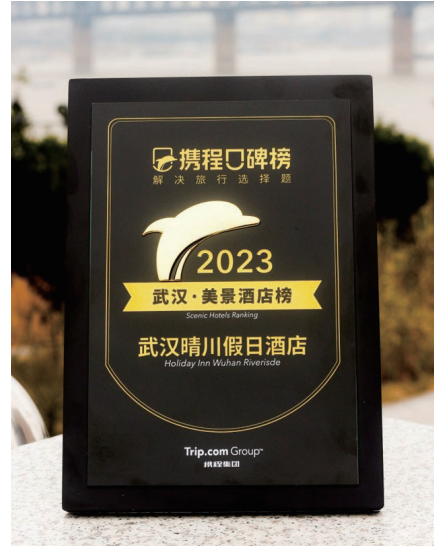
CTRIP 2023 Scenic Hotel Ranking 携程武汉美景酒店榜