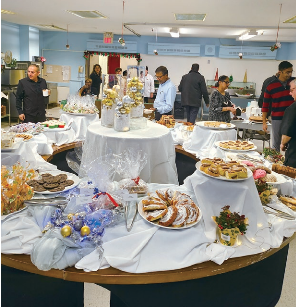
Bake Sale for SickKids Foundation 為病童籌款