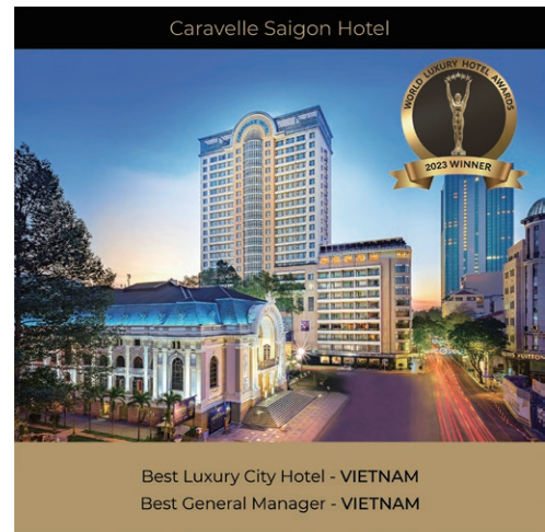
World Luxury Hotel Awards 2023 世界豪華酒店大獎2023