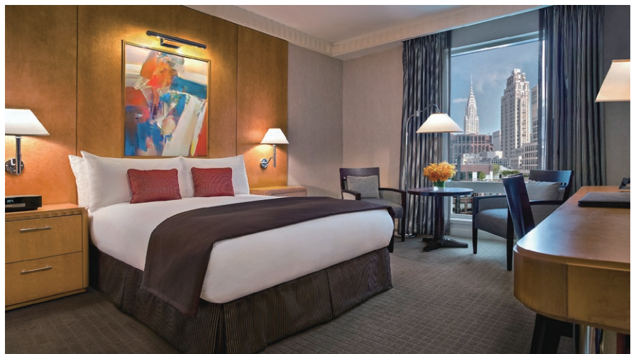
2023 AAA Four Diamond Award 2023 AAA四星鑽石獎

2023 Forbes Travel Guide Recommended Award 2023 福布斯旅遊指南推薦獎