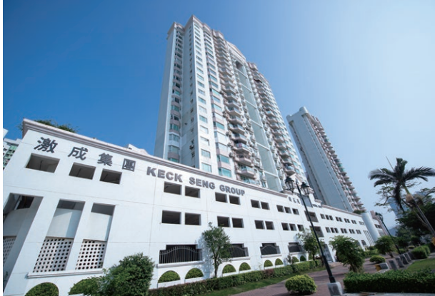
Ocean Gardens, Macau 澳門海洋花園