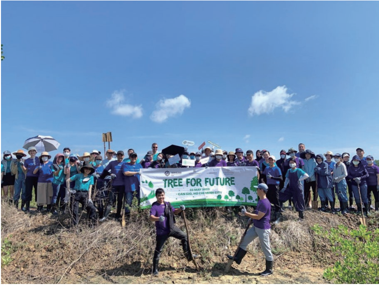
Tree planting at Can Gio Eco Park 種樹活動