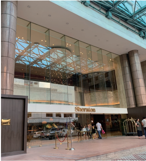
Sheraton Saigon Hotel & Towers, Vietnam 越南胡志明市西貢喜來登酒店