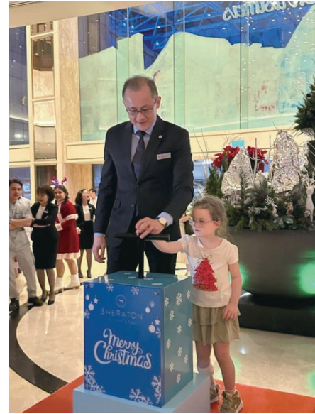
WISH UPON THE STAR Christmas Tree Lighting Day with Christina Noble Children's Foundation 對星許願 克里斯蒂娜貴族兒童基金會聖誕樹點燈日