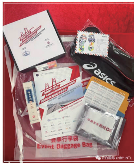
圖左展現了本集團在此活動上的重要贊助商； 圖右展現了雲南白藥氣霧劑(香港版)作為選手包其中不可缺少的產品