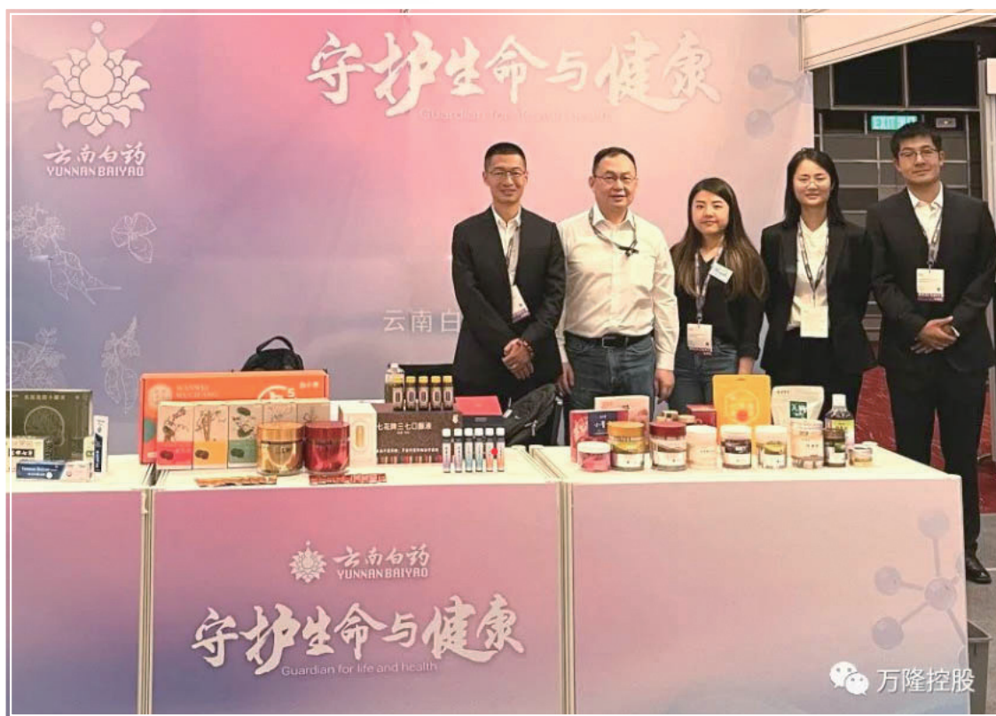
集團在香港美食博覽的中醫藥文化宣傳

本集團專注於在中醫藥領域作出貢獻。本年度，本集團在香港美食博覽中，展示了雲南白藥在大健康領域的佈局、探索和成效。通過數位三七產業平台等多個平台，雲南白藥實施標準化流程管理和全程溯源管理，提升產品和產業品質。參觀者對這些努力給予高度認同。消費者對雲南白藥的歷史使用和品牌表達了認同，並讚賞產品豐富程度以及諮詢購買方式。本集團通過多種方式登記了需求，這些記錄將在開拓香港市場方面提供重要的指引和決策依據。與此同時，本集團也藉此活動促進中醫藥的文化傳承發展及協助中醫藥產品邁向國際化。