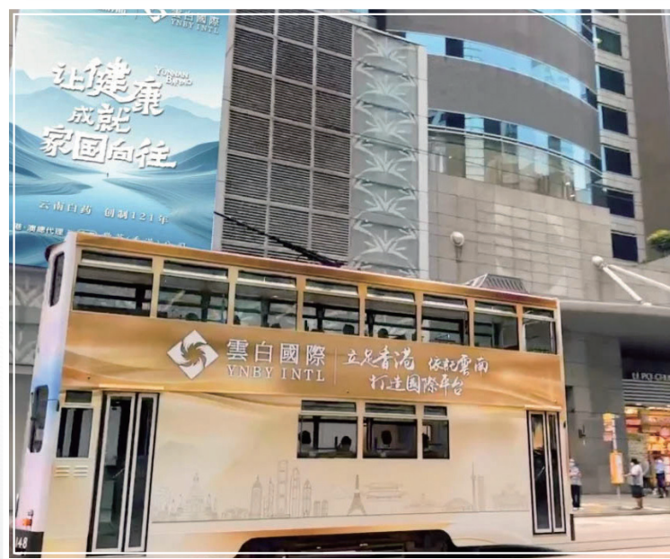
圖上展示了品牌於各個地區的推廣