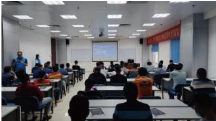
廣州碼頭與南沙港區派出所和龍穴街道綜合治理辦公室聯合組織網絡詐騙宣講培訓會，幫助碼頭作業人員提高網絡詐騙辨別能力和防範能力。