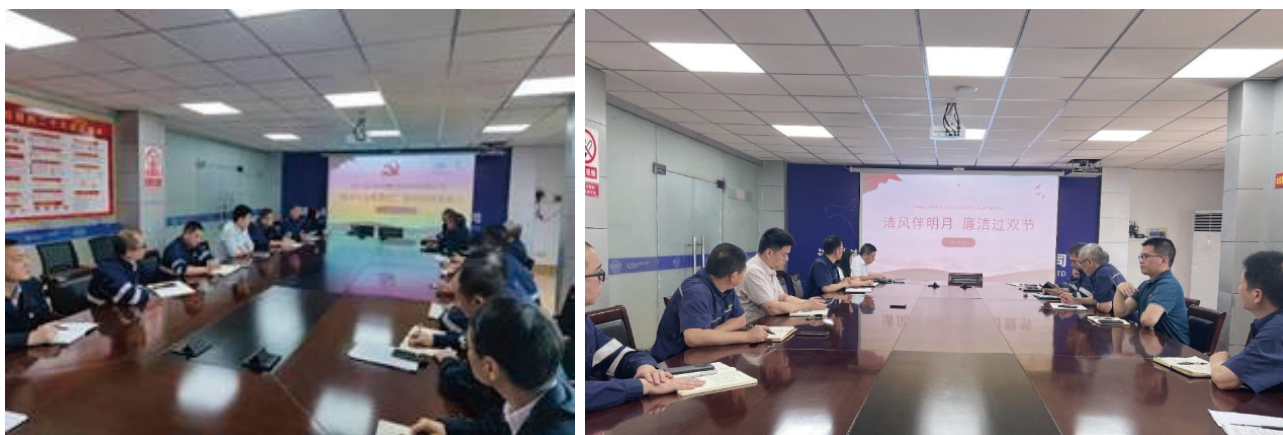
年內，連雲港新東方碼頭開展「廉潔從業教育月」及廉政提醒談話，鞏固員工的廉潔自律意識。

同時，本公司上海總部及附屬控股碼頭開展「廉潔從業教育月」的活動，通過廉潔教育基地參觀、反貪腐知識答題和廉潔教育大會等活動，在各個層級深化反貪腐文化。此外，本公司要求附屬海外控股碼頭充分考慮當地國情，通過研討會、專題講座、統一播放宣傳教育影片或線上課程等方式進行反貪腐培訓，以加強境外廉潔風險防控。