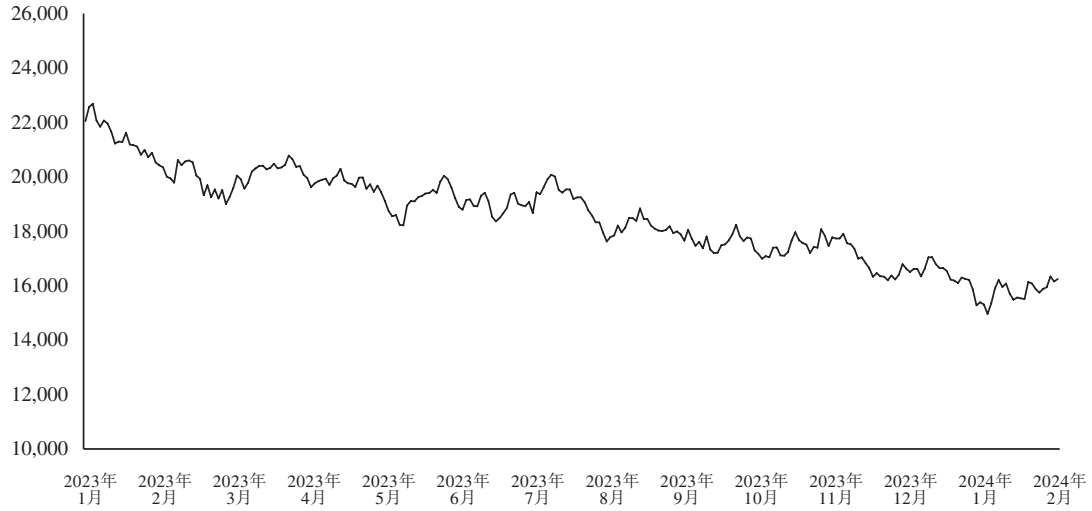
恒生指數過往每日收市點數

鑒於無法對股份自2023年1月20日暫停交易以來的近期表現進行進一步分析，吾等參考香港股市的表現趨勢，根據自2023年1月20日起直至最後實際可行日期（「2023年／2024年回顧期間」）的恒生指數收市點數表現評估H股要約價。