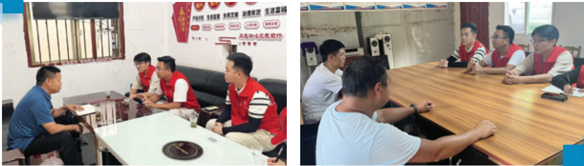
圖：貴州黔南科技學院實踐團與當地村支部書記、企業負責人調研交談

2023年7月，貴州黔南科技學院暑期社會實踐服務團鄉村振興實踐隊先後前往黔南州惠水縣昌明村農業經濟合作社和貴州毅融生態漁業有限公司開展參觀調研活動，探尋合作社和企業的經營管理、增收和銷售情況。通過深入了解鄉村產業發展和農村居民的實際需求，社會實踐團成員在調研報告中提出應對農村產業發展的具體策略，為推動農業升級和鄉村振興出謀劃策。這次活動加深了團隊成員對於鄉村企業發展現狀的理解和認知，並讓成員們意識到了推動鄉村振興的重要使命。