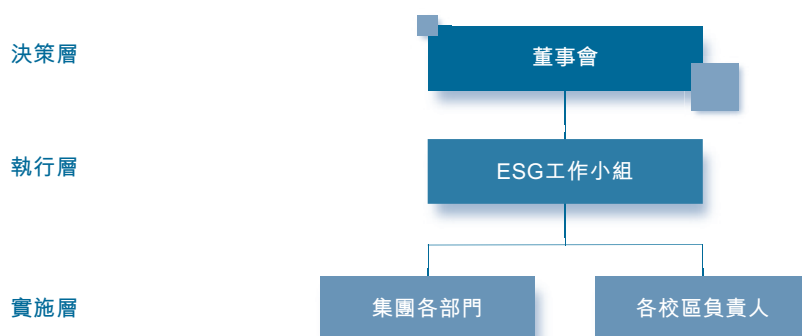
圖：希望教育ESG管治架構

希望教育將可持續發展理念貫徹於整體運營過程中，不斷完善由董事會牽頭、ESG領導小組為主導，覆蓋所有相關部門和學校的ESG管理體系，構建了職權清晰、分層管理、權責明確的「決策層 — 執行層 — 實施層」三級ESG管治架構。董事會負責本集團的ESG報告及重大決策和整體策略；ESG工作小組負責貫徹董事會決議，監督下屬各實施層行使相應職能和ESG工作內容；實施層負責動態反饋實際工作情況，全面跟進並落實各項ESG工作。未來，本集團將從加強各層級配合度及參與度兩方面，優化管治架構，持續提升ESG管控效能。