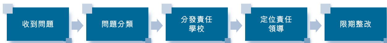
圖：希望教育意見處理機制

為快速響應學生及家長提出的意見和建議，集團內部採取問題快速處理機制，將問題定位分發至各負責單位後，集團層面還會進行持續跟蹤，就學生與家長提出的問題與相關單位進行溝通，審核問題處理結果，並追蹤學生及家長對於問題處理結果的滿意情況。