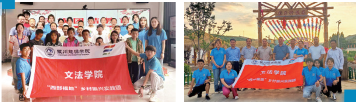
圖：銀川能源學院暑期「鄉村振興」社會實踐活動實踐團

2023年暑期，銀川能源學院文法學院的「西部福地」實踐團前往寧夏西吉縣進行了為期一週的「鄉村振興」主題社會實踐活動。同學們通過深入田間地頭開展勞動實踐、參觀將台堡紅軍會師紀念園、訪問企業創新實踐基地等地，並與村幹部了解交流鄉村振興相關政策和脫貧攻堅的成效，在實踐中感受鄉村振興帶來的社會發展，極大地提升了他們對於國家鄉村振興戰略的認識，也激起了學生們對於文化、生態以及經濟社會進步等方面的深入思考和學習動力。