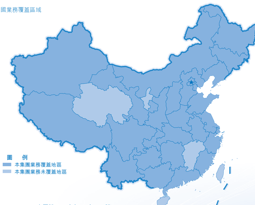
圖例 ■ 本集團業務覆蓋地區 ■ 本集團業務未覆蓋地區