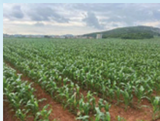
雲南蔬菜種植基地