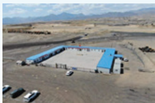
星亮礦業的員工宿舍