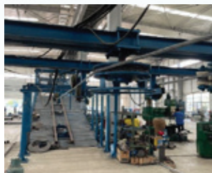
滕州凱源的日常營運情況