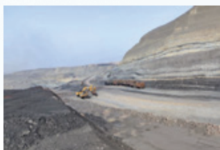
星亮礦業的日常情況