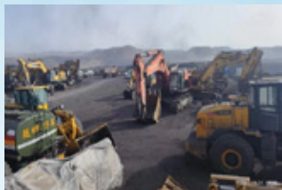
各類施工機械在礦區待機