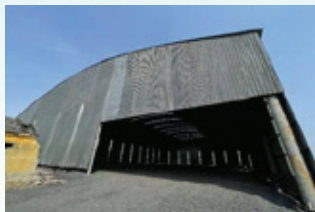
山東凱萊的日常營運情況