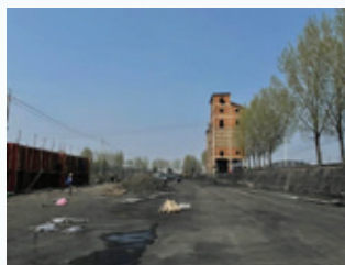
山東凱萊重建圍牆工程