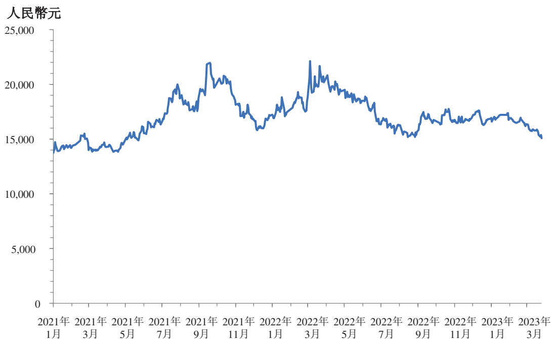
不鏽鋼歷史每日收盤價(每公噸)

就吾等之盡職審查而言，吾等根據自Wind金融終端(Wind Financial Terminal)取得的資料，研究了回顧期間的不鏽鋼價格。由於回顧期間為公告日前的大約兩年期間，吾等認為該期間屬公平及具代表性。