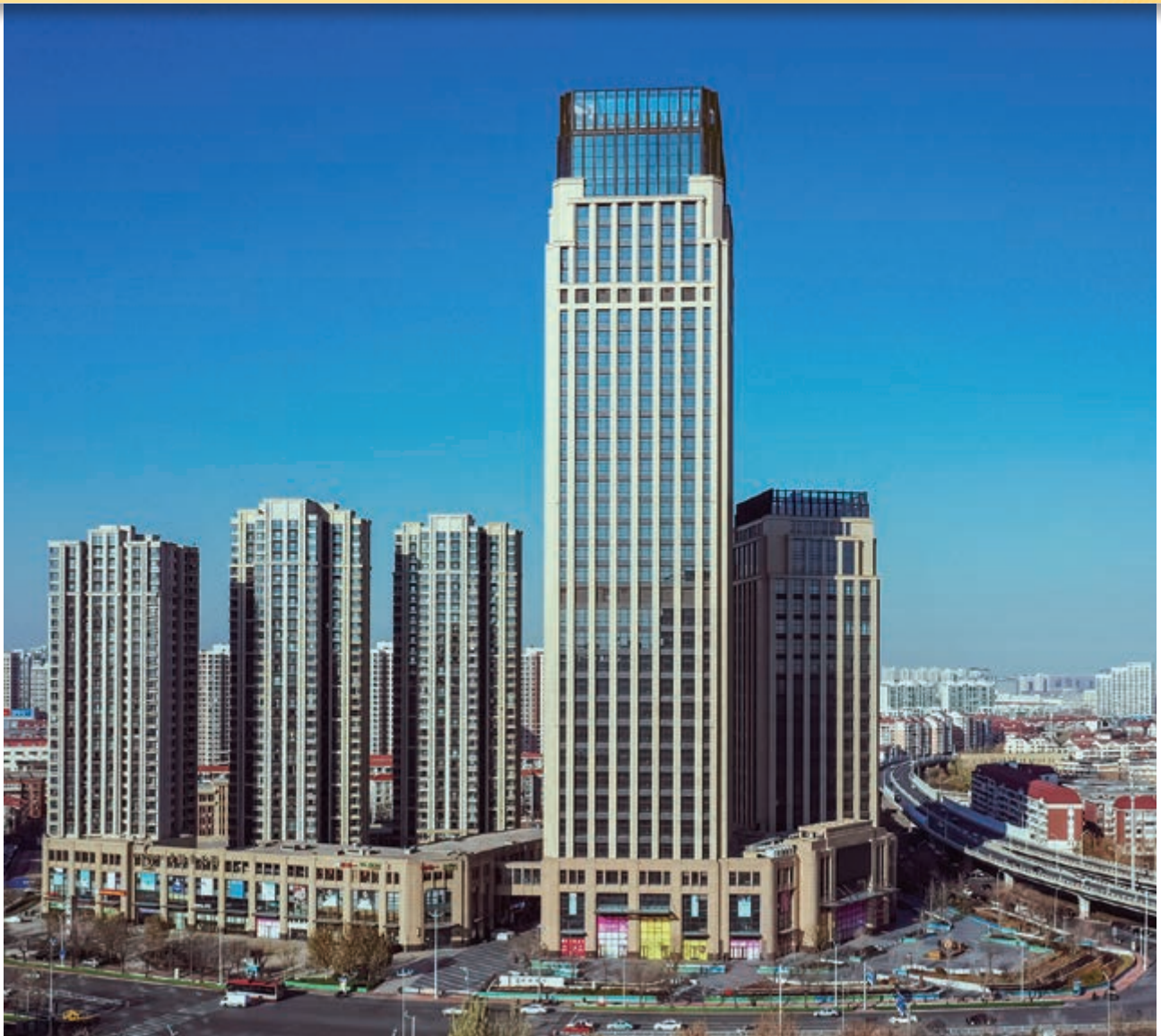
富豪新開門 — 位於天津河東區黃金地段之商業/寫字樓/住宅綜合發展項目