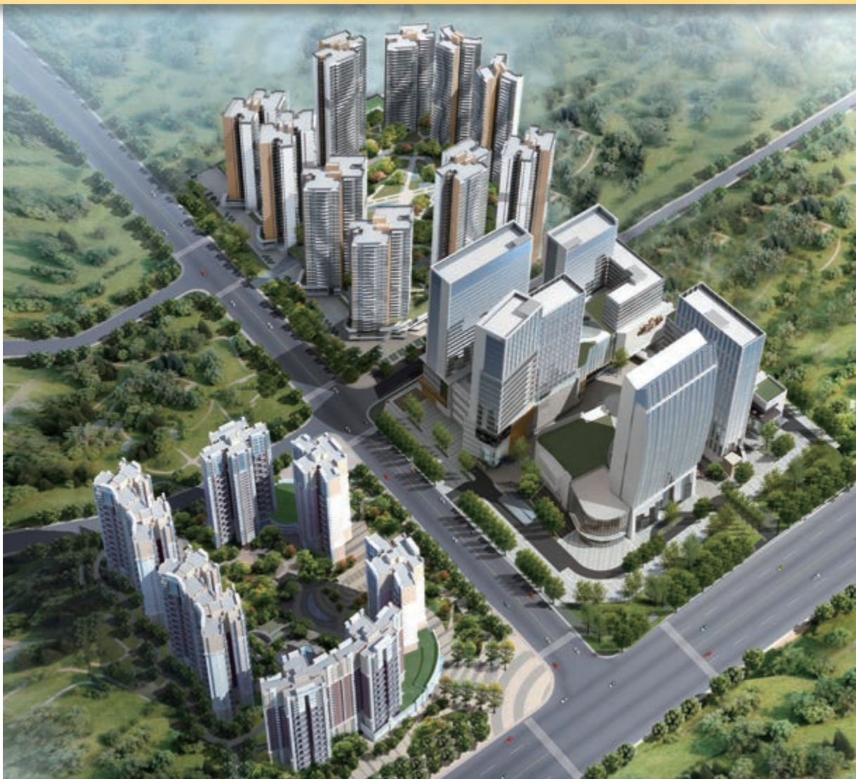
富豪國際新都薈 — 位於四川成都新都區之住宅/商業/寫字樓/酒店綜合發展項目(*)