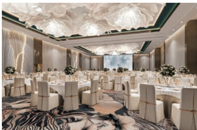
富豪新都酒店之宴會廳(*)