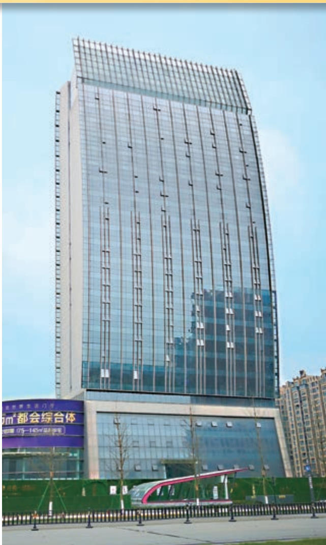
富豪國際新都薈之酒店發展項目 富豪新都酒店