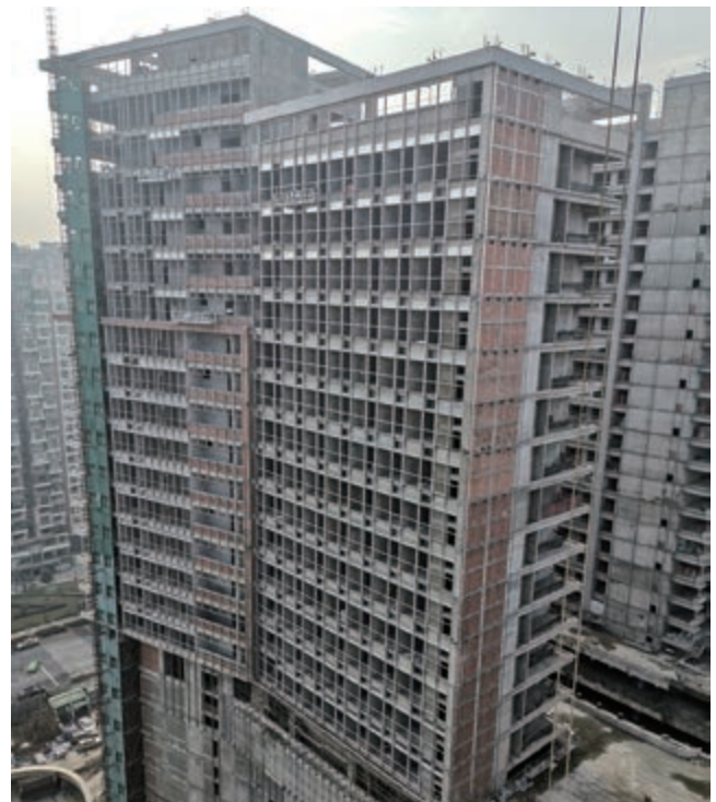
富豪國際新都薈之商業/寫字樓大樓 — 上蓋建築工程現正進行中