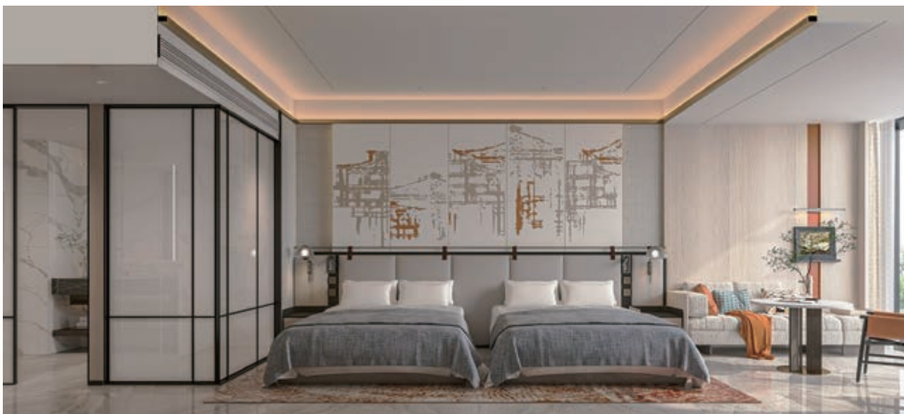
富豪新都酒店之客房(*)