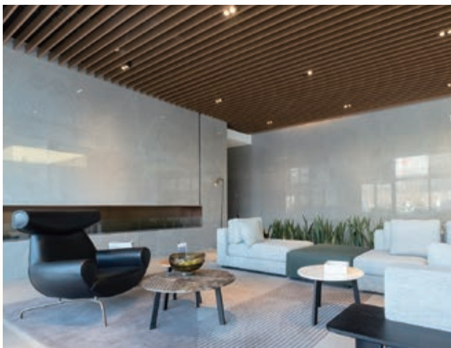
寫字樓大樓之大堂