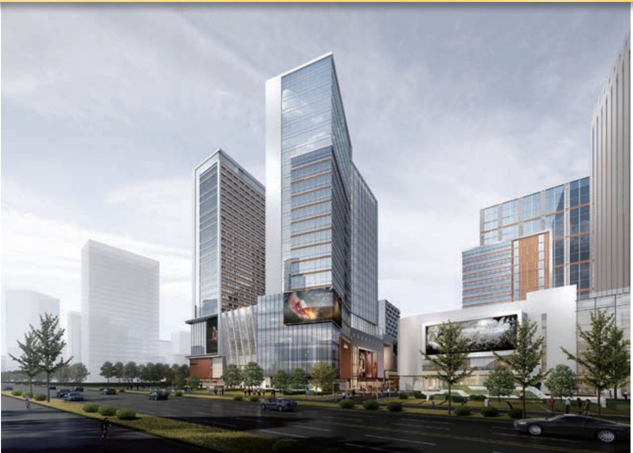
富豪國際新都薈之商業/寫字樓大樓(*)