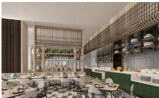
富豪新都酒店之全天候餐廳(*)