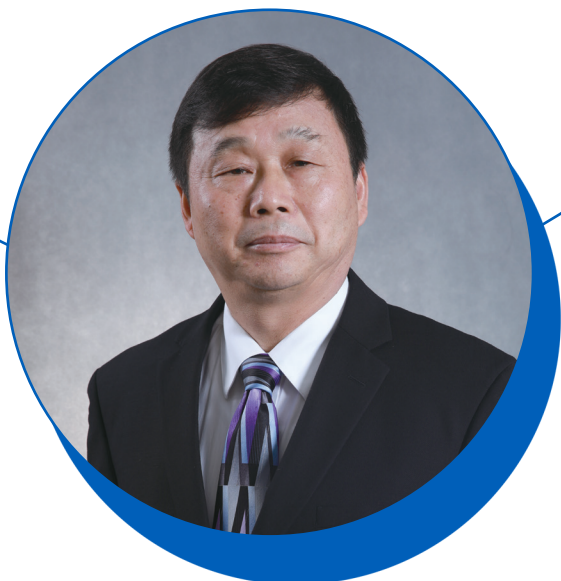
主席兼首席執行官 徐耀昌博士