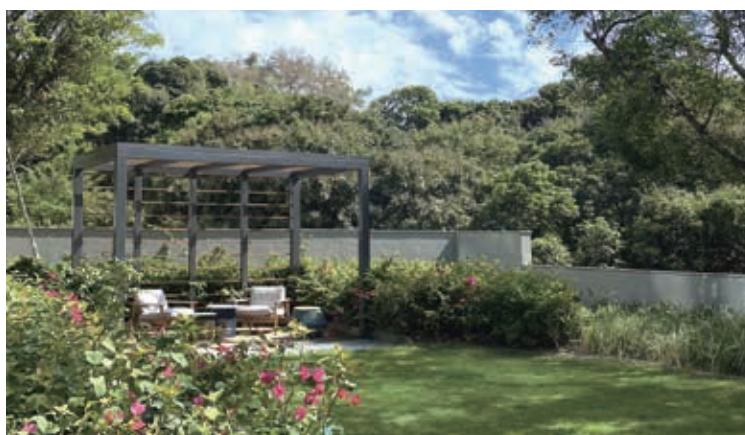
OMA OMA, Tuen Mun, was completed in 2021. 屯門OMA OMA於2021年落成。