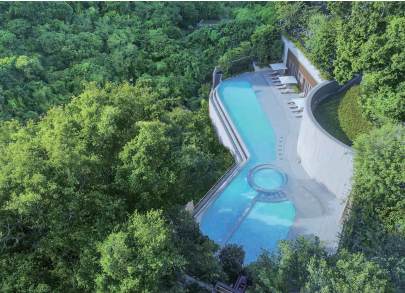
OMA OMA, Tuen Mun, was completed in 2021. 屯門OMA OMA於2021年落成。