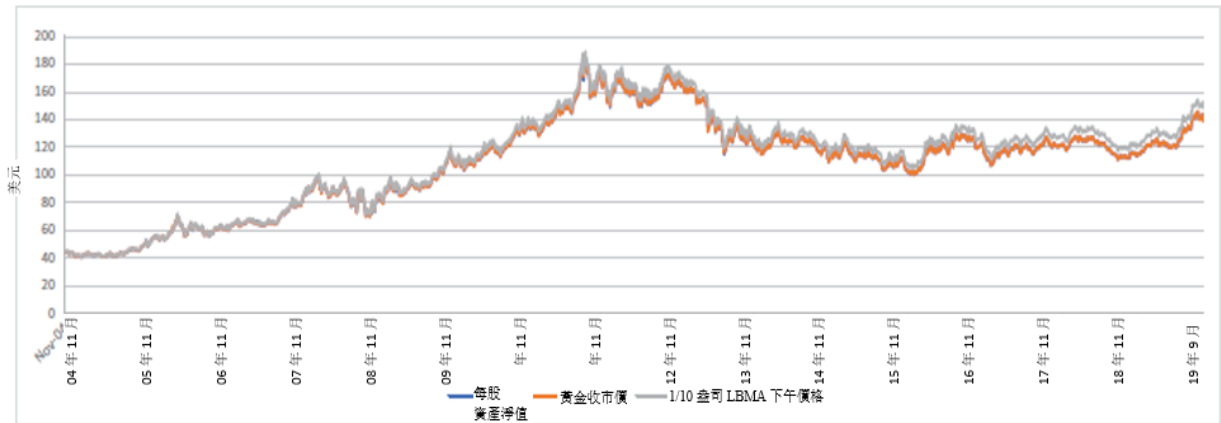
股價及資產淨值與金價比較圖 - 由 2004 年 11 月 18 日至 2019 年 9 月 30 日

下圖提供黃金價格的歷史背景。該圖闡明由2004年11月18日至2019年9月30日期間每盎司美元黃金價格的變動，並自2015年3月20日起以LBMA下午黃金價格為基準，而2015年3月20日前則以倫敦下午定價為基準。