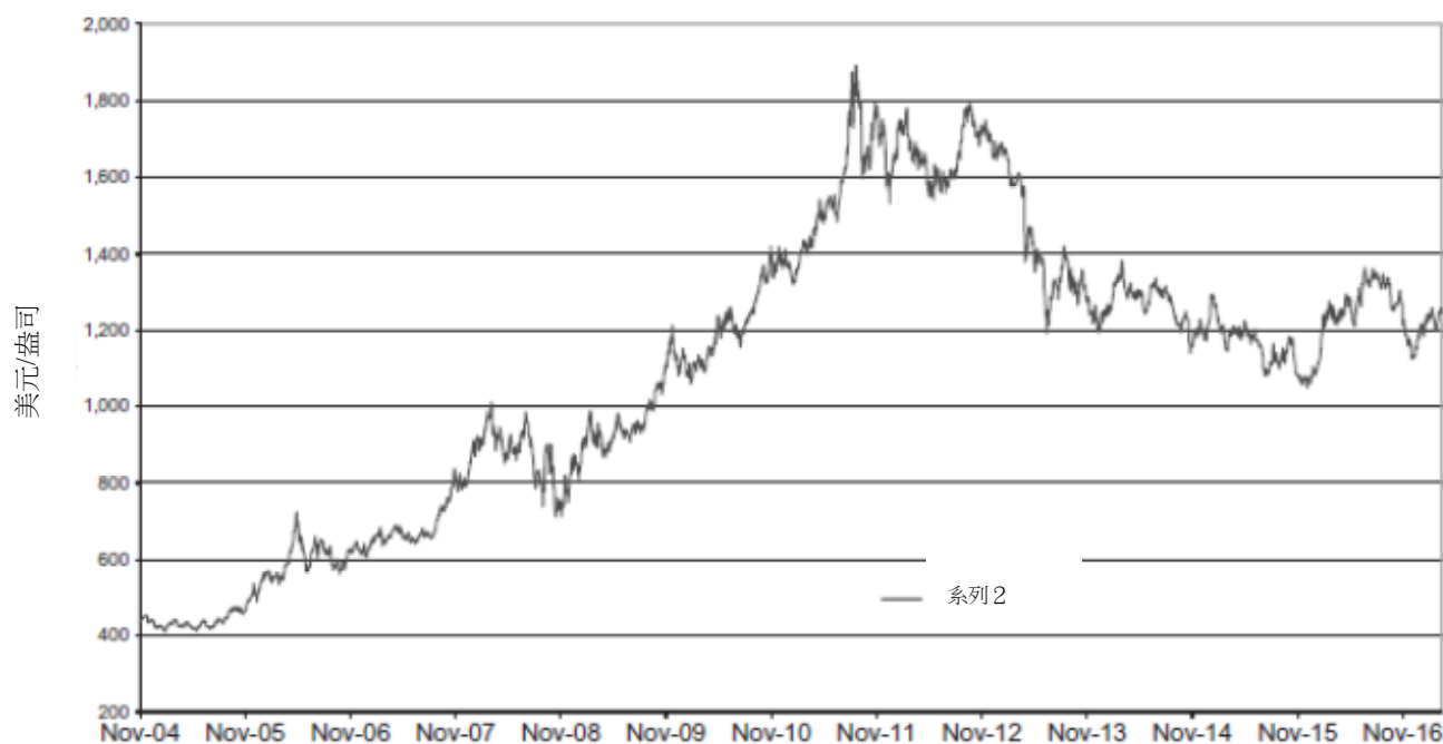
每日金價 — 2004年11月18日至2017年3月31日

下圖提供黃金價格的歷史背景。圖表闡明由2004年11月18日股份開始在紐約交易所買賣之日起至2017年3月31日期間每盎司美元黃金價格的變動，並自2015年3月20日開始提供的LBMA下午黃金價格為基準，而先前則以倫敦下午定價為基準。